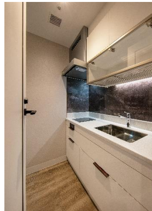
【 室内キッチン 】