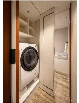
【 室内ランドリー 】

この度、会員特別サービスをご体感頂ける「エスパシオ体験宿泊プラン」の販売を開始いたします。 是非、この機会に生まれ変わった客室で『 Beyond The Luxury 』をご体験ください。